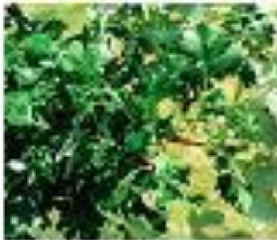
Базовое средство: Рескью Ремеди